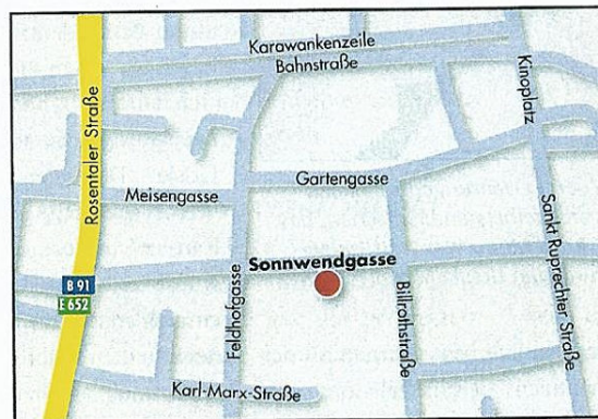
Im Klagenfurter Stadtteil St. Ruprecht befindet sich das KreWiz, das längst über einen Insidertipp hinausgewachsen ist

mierte Apfelweine, Hauerweine, Fruchtnektare und sortenreine Apfelsäfte.